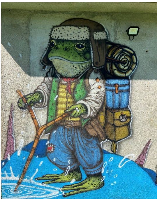
CrazySpray Graffiti - L'Eau