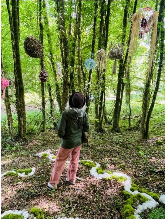
Atelier Graine de lumière Nid de graines