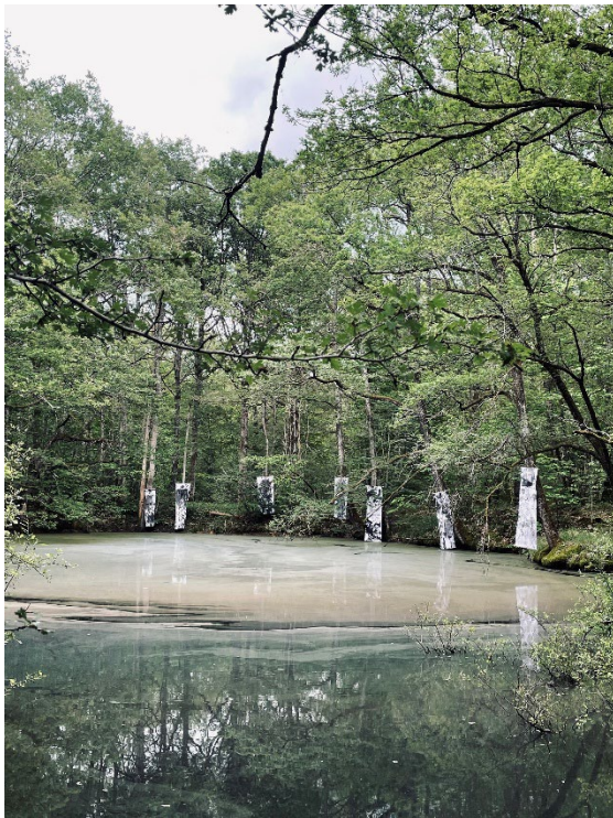
Johanna Letchimy – Poétique du paysage