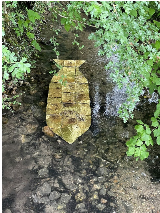
Etienne Boyer Eau précieuse , métal et fil de pêche